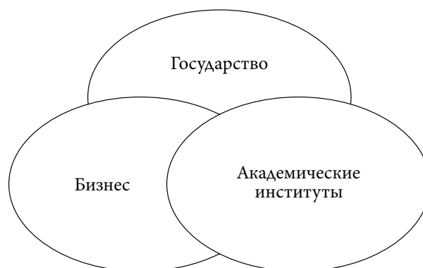
Рисунок 2 – Высшее образование – «тройная спираль» инновационного развития Figure 2 – Higher education as the “triple helix” of innovative development

Для российского общества все еще актуально осмысление инновационности. Так, «тройная спираль» (Г. Ицковиц) является одной из самых распространенных и признанных во всем мире моделей инновационного развития экономики. Институты, способные выполнять нетрадиционные функции, считаются наиважнейшим источником инноваций. В связи с этим преимуществом модели является ее нелинейный характер и возможность использования для построения более сложных и гибких систем управления, обеспечивающих инновационное развитие региональной экономики. Она включает в себя три основных элемента: государство, бизнес, академические