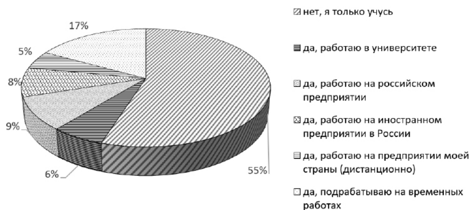
Рисунок 3 – Результаты ответа на вопрос иностранных студентов «Совмещаете ли Вы учебу с работой?», %

данные подтверждаются и результатами другого исследования авторов настоящей статьи, связанного с анализом китайской образовательной миграции [9]. Среди россиян, проходивших обучение в вузах-партнерах УрФУ, этот показатель чуть меньше – 43%. На рисунке 3 можно увидеть, где в России трудоустраиваются иностранные студенты.