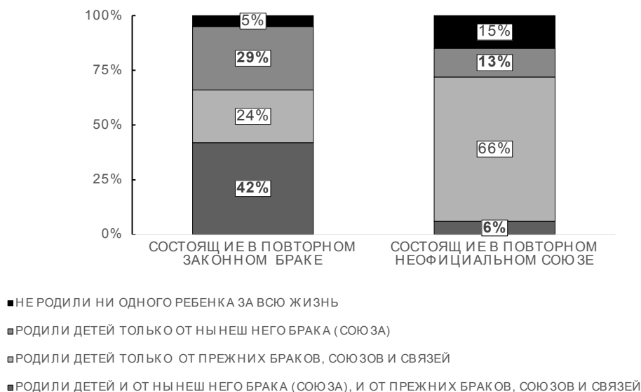
Рисунок 3 – Распределение (в %) женщин 40–44 лет, состоящих в повторном законном браке или неофициальном союзе по отцовству их детей Figure 3 – Distribution (in %) of women aged 40–44 in a new legal marriage or in an informal union (after previous marriage or union) by origin of children born to them

родили в этом браке еще одного, а иногда и нескольких детей (рисунок 3).