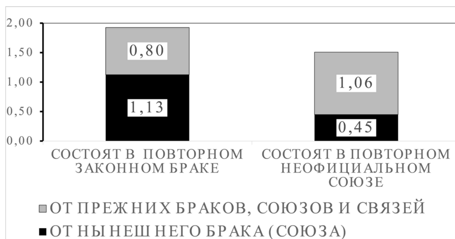
Рисунок 2 – Среднее число детей, рожденных в нынешнем браке (союзе) у женщин 40–44 лет, состоящих в повторном законном браке или в повторном неофициальном супружеском союзе

По суммарным данным трех раундов исследования «Родители и дети, мужчины и женщины в семье и обществе (РиДМиЖ)», проведенного в России в 2004, 2007 и 2011 гг. в рамках международной программы Generation and Gender, среди «брачно-партнерских союзов» (в их число входят и браки, и сожительства), сформировавшихся в 1990–1999 гг., распались до момента исследования (независимо от оформления развода) 68% законных браков без детей и 28% – с детьми, а среди сожительствующих пар соответственно 88% и 44% [7, с. 106]. Частота распада брачно-партнерских союзов, возникших в те же годы, за первые 10 лет их существования (независимо от регистрации в ЗАГСх создания и разрушения этих союзов), составила 31% как для первых, так и для повторных союзов (без учета овдовения) [11, с. 76–77]. Это опровергает популярное мнение о том, что вторые браки прочнее первых. Но если опыт неудачного брака иногда способствует более правильному выбору нового супруга, это преимущество нередко нивелируется проблемами в отношениях между отчимом и ребенком жены. Влияние повторных брачно-партнерских союзов на рождаемость зависит от их регистрации (рисунки 2).