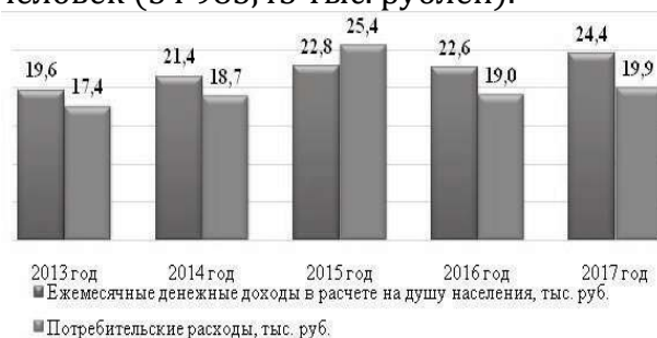
Рис. 3. Динамика доходов и расходов населения Ставропольского края в расчет на душу населения (2013-2017 гг.), тыс. рублей

собие на ребенка за 9 месяцев 2018 г. получили 104 321 человек на общую сумму 953 601,40 тыс. рублей, государственную социальную помощь – 13 727 человек (54 985,45 тыс. рублей).