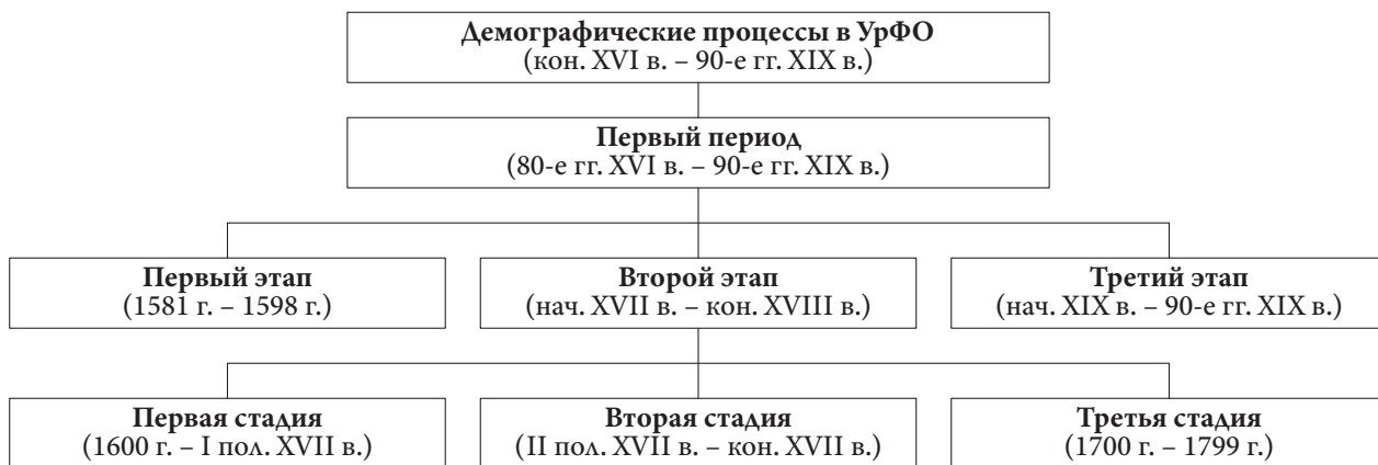
Рис. 1. Классификация государственного управления демографическими процессами в УрФО с конца XVI в. и по 90-е гг. XIX в.

Так, в Уральском федеральном округе наблюдается особенность, заключающаяся в неравномерности и противоположности демографических процессов, связанных с естественным движением населения в его субъектах. Например, для Тюменской области, Ханты-Мансийского и Ямало-Ненецкого автономных округов характерно стабильное увеличение численности населения. В то же время иная ситуация происходит в Курганской, Свердловской и Челябинской областях, в которых наблюдается длительное сокращение численности населения, что приводит к демографическому кризису.