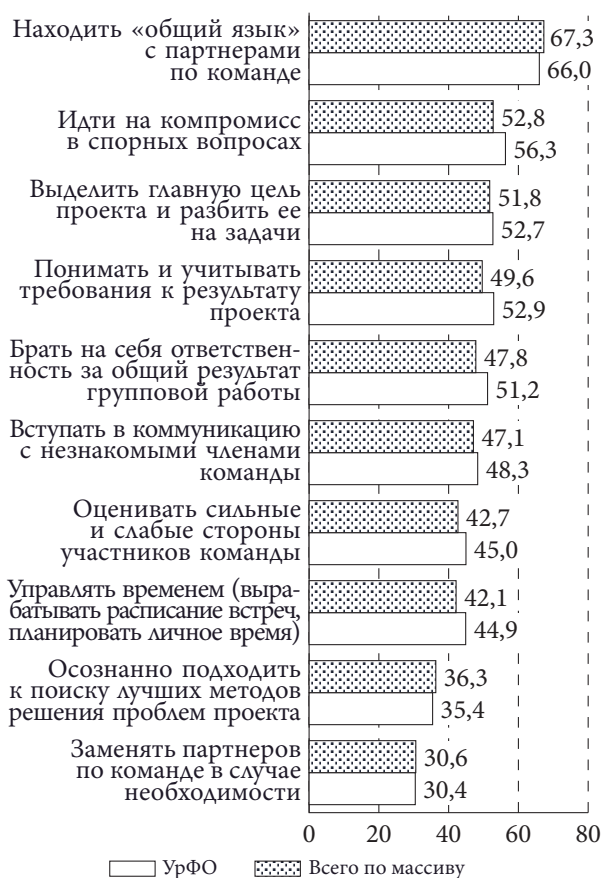
Рисунок 3 – Навыки для проектной деятельности, сформированные у студентов до поступления в вуз, в % от числа ответивших

Профессионально-педагогический опыт авторов статьи показал, что организаторы и кураторы проектного обучения в качестве ключевых проблем адаптации студентов выделяют их неготовность к ответственности и самостоятельности – основным организационным и этическим требованиям данного формата обучения. Важным барьером они также считают недостаточно высокий уровень профессиональной культуры и профессиональных знаний, который расходится с ожиданиями заказчиков проектов. По мнению руководителей проектов, вместе с развитием проектной методологии в школах и вузах острота проблемы адаптации к проектной деятельности у студентов будет снижаться.