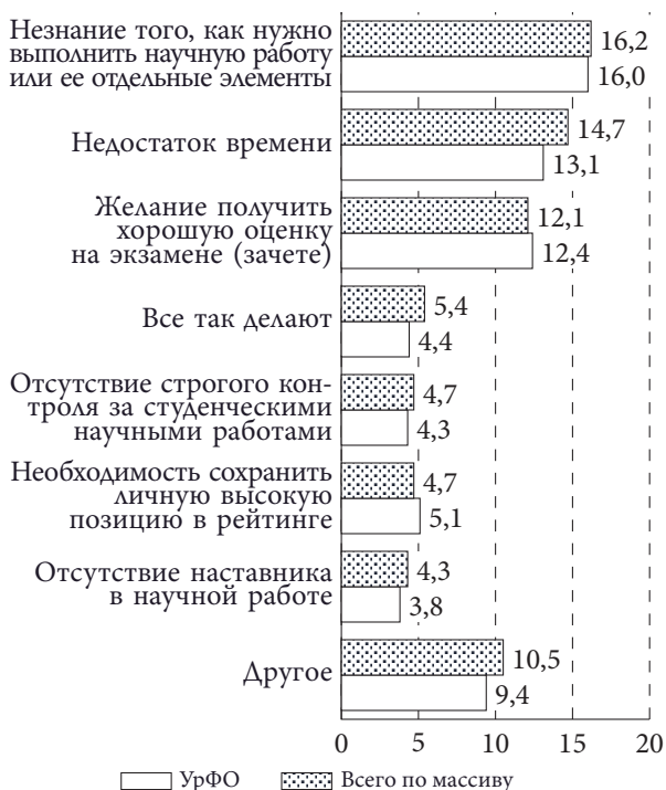
Рисунок 1 – Причины использования способов академического мошенничества, в % от ответивших Figure 1 – Reasons for using methods of academic fraud, in % of respondents

По данным исследования, около 73 % опрошенных студентов из общероссийской выборки и около 82 % уральских студентов участвует в проектной деятельности – новом формате учебной работы, продуктивном в плане формирования