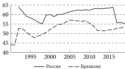
Рисунок 3 – Распределение доли женщин в экономически активном населении России и Бразилии (1990–2020 гг., в %) 4

Figure 3 – Labor force participation rate, female (% of female population ages 15+) (national estimate) – Russian Federation, Brazil