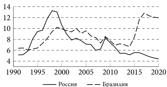
Рисунок 4 – Распределение уровня безработицы в России и Бразилии (1990–2020 гг., в %) 5

Figure 3 – Labor force participation rate, female (% of female population ages 15+) (national estimate) – Russian Federation, Brazil