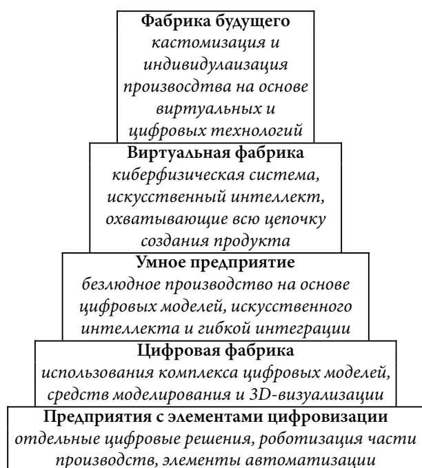
Рисунок 1 – Пирамида понятий предприятий Индустрии 4.0

В основе пирамиды авторами указано предприятие с элементами цифровизации как подготовительный этап, который проходит предприятие, поставившее перед собой цель создания «умного» производства или фабрики будущего. Как правило, лишь создавая производство с нуля, возможно сразу начать с этапа цифровой фабрики или «умного» предприятия, изменения же существующих производств происходят постепенно путем внедрения новых технологий, методов управления и цифровых систем.